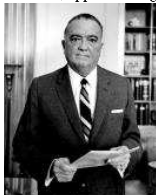
John Edgar Hoover (1895-1972)

John Edgar Hoover (1895-1972) az FBI igazgatója volt 1924-től haláláig, azaz majdnem fél évszázadon át, ami akkor is rekord teljesítmény lenne, ha „uralkodása” nem az USA és az egész 20. századi világtörténelem legkritikusabb korszakán ívelt volna át. A II. világháború és a hidegháború évei a titkosszolgálatok és a bűnüldözés területén igazán koncentrált munkát igényeltek. J.E. Hoover gondolatait tehát hiteles forrásnak tekinthetjük, amikor az FBI-ról van szó. Nos, éppen a hidegháborús időszak közepén, 1956-ban a Look magazin -nak nyilatkozta a