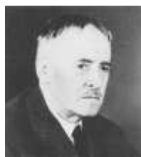
Henry L. Stimson (1867-1950)

„Úriember nem olvassa el mások levelét.” 1 - mondta Henry L. Stimson, aki az Amerikai Egyesült Államok külügyminisztere és a rejtjelrejtő szolgálat főnöke volt az 1920-as évek végén. Eme szállóigévé vált mondása alapján 1929. október 31-én bezárta kapuit az USA rejtjelző és rejtjelrejtő szolgálata (a Black Chamber). Sajnos azonban a történelem nem Őt igazolta, így Stimson „úriember” felfogása (mindannyiunk nagy sajnálatára) sem a múltban, sem a jelenben és nagy valószínűséggel a jövőben sem lesz több, mint szállóige.