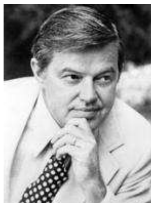
Frank Church (1924-1984)

Ugyanis húsz évvel J.E. Hoover idézett nyilatkozata és mindössze 3 évvel halála után, az Egyesült Államokban már kiszivárogtak az addig szigorúan titkos ECHELON kémműhold rendszer létezéséről információk. Ezek alapján, a felvilágosult és a civil társadalomért, az emberi szabadságjogokért felelősséget érző politikusok megvalósulni látták az Orwell-i