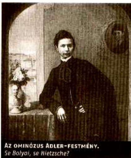
AZ OMINÓZUS ADLER-FESTMÉNY. Se Bolyai, se Nietzsche?

MÉG HA A MODELL KILÉTÉT homály fedi is, az korántsem meglepő, hogy az ifjabb Bolyairól – apjával ellentétben – egyetlen korabeli, hitelesnek tekinthető ábrázolás sem maradt az utókorra. A Marosvásárhelyi Református Kollégium neves matematika-, fizika- és kémiaprofesszoraként már életében is köztiszteletnek örvendett Bolyai Farkassal ellentétben a külön fiútól tisztes távolságot tartottak. Az „Öreget” 1856-ban hatalmas tömeg kísérte utolsó útjára, négy évvel később elhunyt, hadmérnökként